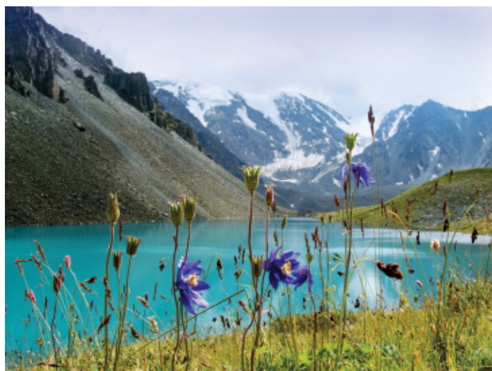
Разговор с тишиной