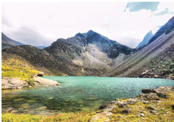
Озеро горных духов